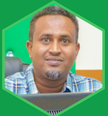
Head of Event Mgt. & Coordination

Wixii talo iyo toosin ah ee aanu ku horumarin karo xogsidahan iyo guud ahaanba shaqada Wasaaradda waxaad nagula wadaagi kartaan Email-ka Wasaaradda: Info@slmof.org ama formka cabashada iyo talooyinka ee Website-ka W.H.Maaliyada www.Slmof.org .