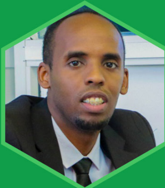
Head of Production